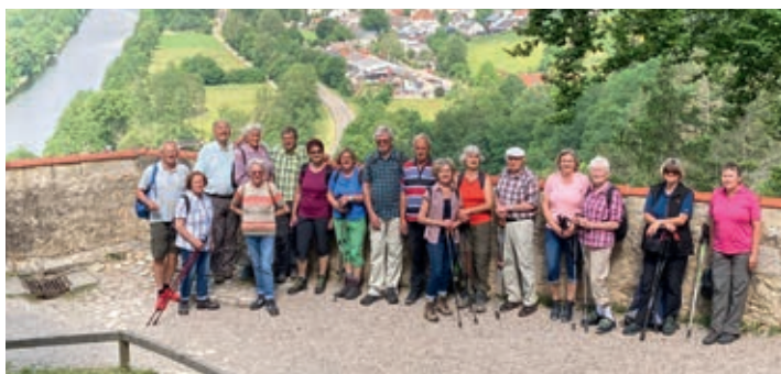
Aufnahme von Burg Prunn ins Altmühltal

Bereits um 8 Uhr trafen sich die Pommelsbrunner NaturFreunde-Senioren zur Juniwanderung die ins Altmühltal führte. Wir fuhren über die A 9 bis Ausfahrt Denkendorf und dann Richtung Riedenburg bis Prunn, unserem Ausgangspunkt der Wanderung. Am Ortseingang parkten wir unsere Fahrzeuge und marschierten ein kurzes Stück durch den Ort bis zum Wegweiser „Burg Prunn“. Am Ortsende beim Waldrand leitete uns rechter Hand ein Pfad mit der Markierung Nr. 17 in den Wald hinein. Der Weg wurde zusehends steiler, was unseren Kreislauf gleich in Schwung brachte. Schnell gewannen wir an Höhe und gelangten zu einem Steig, welcher von Felspartien und knorrigen Bäumen umsäumt wurde. Hier oben genossen wir einen herrlichen Blick ins Altmühltal. Etwas später trafen wir auf einen Schotterweg, der direkt vom