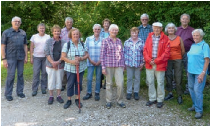
Das Bild zeigt die „Restgruppe“ am Startpunkt der Wanderung