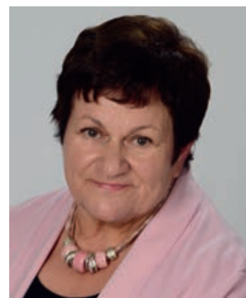
Gabi Bleisteiner 3. Bürgermeisterin