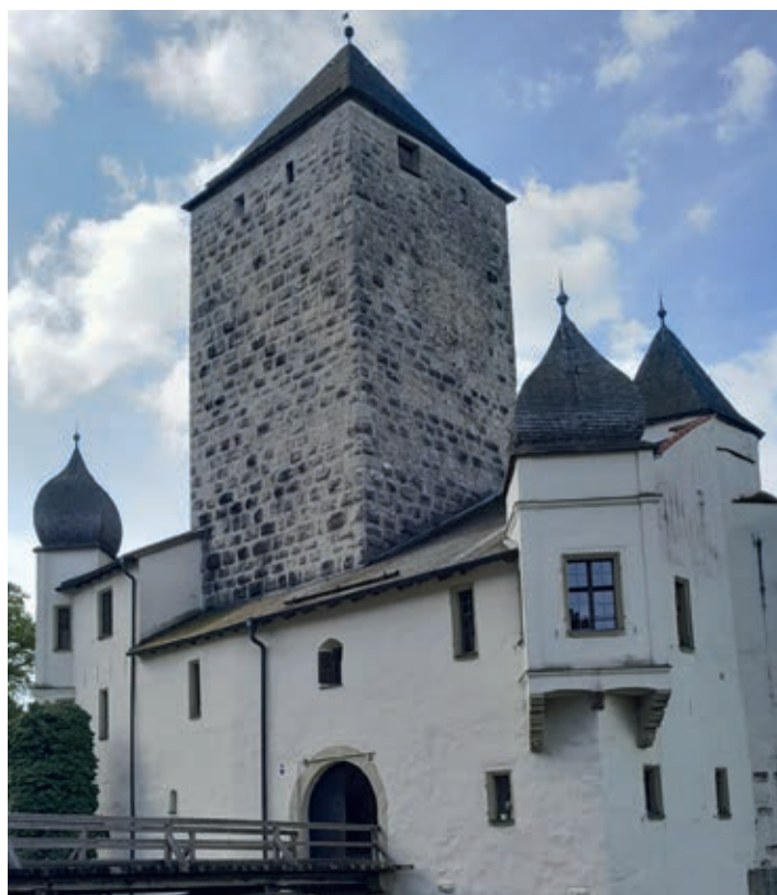
Burg Prunn im Altmühltal

zurücklegen „durften“! An Deck ließen wir unsere Tour noch einmal Revue passieren und genossen das sanfte Dahingleiten im Wasser. Vorm 1986 gebauten „Tatzlwurm“, Deutschlands längster geschwungener Holzbrücke mit 193 Metern wurde noch schnell ein Foto geschossen bevor wir in Nußhausen von Bord gingen. Zu unseren Autos liefen wir durch den Ort Prunn und auf schnellstem Weg ging es wieder Richtung Heimat.