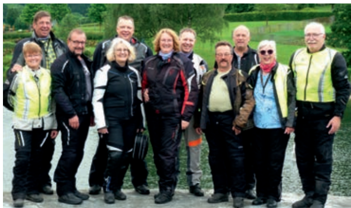
Gruppenfoto am Rechberger See.

An Fronleichnam hieß es wieder „auf die Sättel“ zur alljährlichen 4-Tagesausfahrt der Pommelsbrunner NaturFreunde. Mit 7 Motorrädern und 11 Personen ging es diesmal ins Nachbarland Österreich. Vom Treffpunkt am Pommelsbrunner Feuerwehrhaus startete man pünktlich um 9 Uhr. Über Schwandorf, Schwarzenfeld und Nabburg führte die Route nach Neunburg v.W., wo man eine erstmalige Rast einlegte. Wie vom Wetterbericht vorhergesagt, türmten sich leider immer mehr Regenwolken auf und bei Regen erwischte die Biker zum ersten mal ein Gewittersturm. Zum Glück klarte es bald wieder auf, so dass man die Weiterfahrt entlang der Kulisse des Bayerischen- und des Böhmerwaldes genießen konnte. Bei Schwarzenberg über-