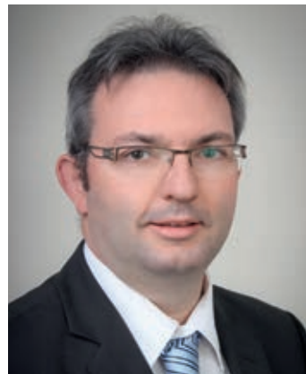
Thorsten Brunner 2. Bürgermeister