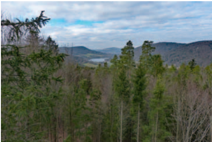
Die Gruppe an der „Hütte am Vogelfelsen“