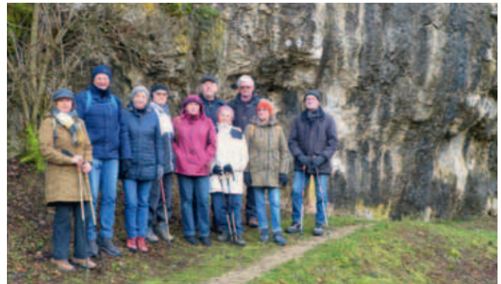
An der Felsformation vor Velden

melsbrunn vollgeladen, um zum Startpunkt in Velden zu fahren. Welch eine Überraschung: Am Startpunkt angekommen, kommt die Sonne heraus und verheißt einen guten Tag. Nach der Pegnitzüberquerung beim Parkplatz bei der Stockschießhalle, führt der Weg an der mächtigen Felsformation vor dem Orteingang durch das Stadttor, dem so-