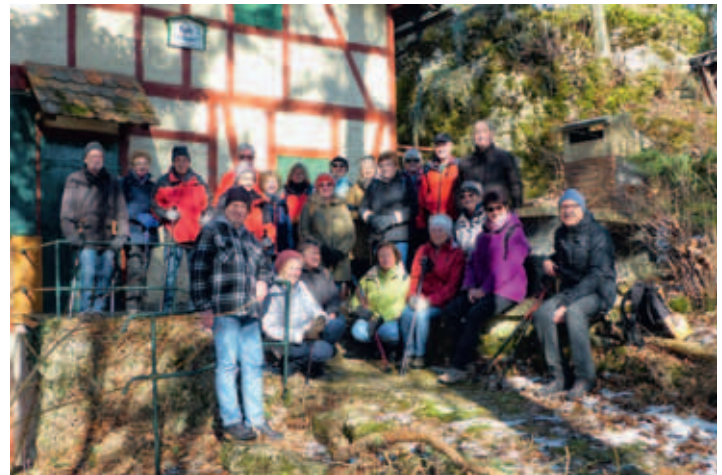
Ausblick vom Vogelfelsen nach Hersbruck

Zur Märzwanderung der Wandergruppe der Pommelsbrunner Naturfreunde trifft am bekannten Sammel-