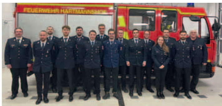
Das Bild zeigt alle beförderten sowie geehrten Kameraden/in

Eine bisher einmalige Jahreshauptversammlung für die Feuerwehr Hartmannshof fand am Samstag den 14.01.2023 in deren Gerätehaus statt. Erstmals in der Geschichte des Feuerwehrvereins wurde in diesem Jahr auf die beiden letzten Jahre 2022 und 2021 zurückgeblickt. Aufgrund der strengen Hygienevorschriften