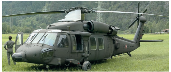
Der UH60 Blackhawk

Auf einer Dichtung an dem Teil finden wir einen Hinweis, eine Teilenummer >70217 027051 08< – und da heute alle Flugzeug-Originalteile ebenfalls in Datenbanken verzeichnet sind, ist