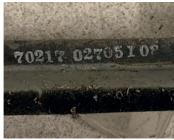
Die Teilenummer auf dem gefundenen Artefakt.

Aber halt, noch ist unsere Geschichte nicht ganz zu Ende – was ist denn nun mit dem Flugzeugteil? Nachdem wir nun die abgestürzte Maschine, die Lockheed P38L Light-