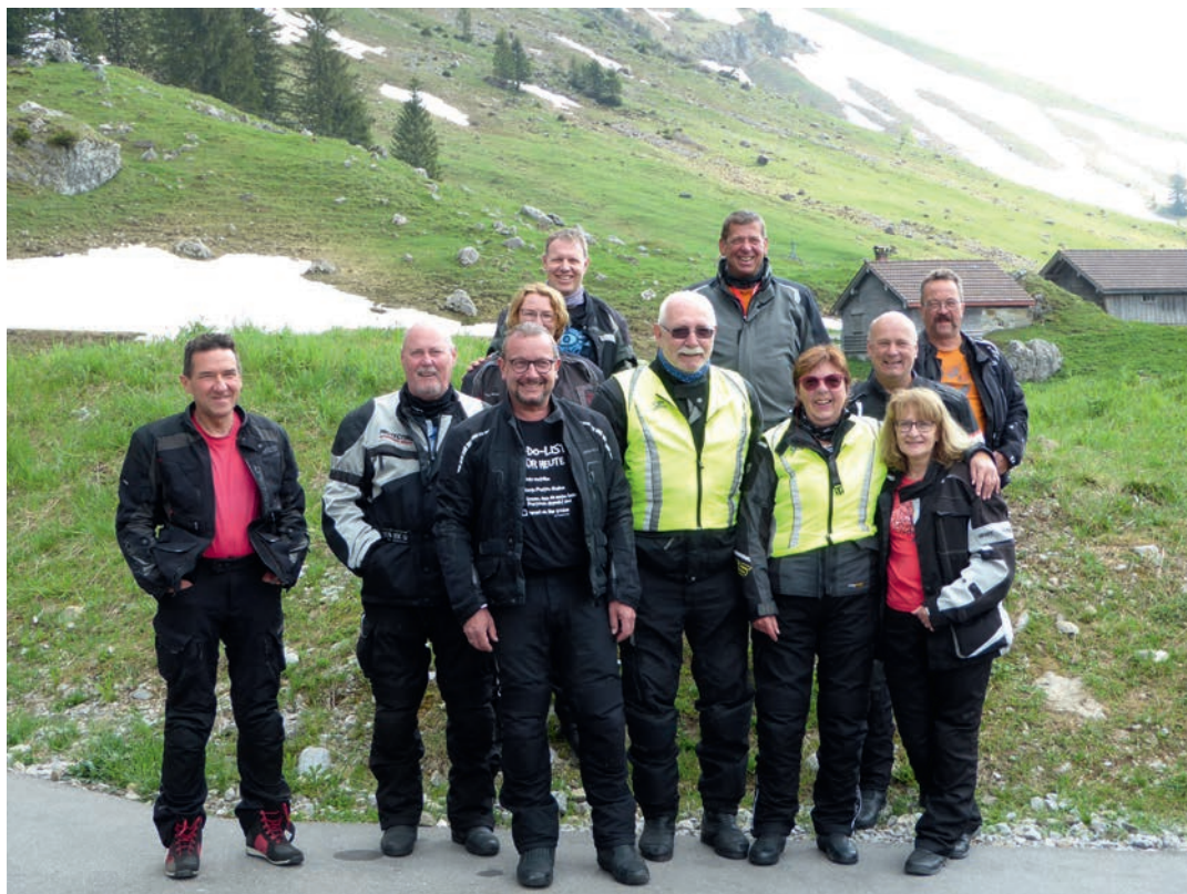
Die Gruppe vor dem Säntis-Massiv

Motorsportler der Pommelsbrunner NaturFreunde unterwegs