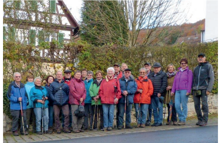
Die Gruppe vor dem Pfarrhaus und der Kirche in Eschenbach.

rung, zu bewältigen. Der Jahreszeit entsprechend sind die Wege teilweise sehr nass und rutschig. Deshalb ist angepasstes Gehen angesagt. Von Hubmersberg aus soll die Grünpunktmarkierung zur Windburg und dem Wachtfelsen führen, einem wunderbaren Aussichtspunkt in das Högenbach- und Pegnitztal. Durch Holzeinschlag ist die Markierung verschwunden und so wird dieser Punkt verfehlt. Über den steilen Fahrweg von Hubmersberg nach Eschenbach, am Kriegerdenkmal vorbei erreicht die Gruppe Eschenbach. Es hat leicht zu nieseln begonnen. Da sind alle froh, in die war-