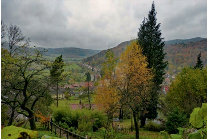
Eschenbach mit dem Blick in's Pegnitztal.