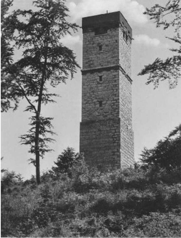
Arzbergturm auf einer Postkarte aus den 1940er Jahren - vollkommen freistehend

Wie immer, ist der Treffpunkt der Wanderfreunde/innen für die monatliche Wanderung, die Bushaltestelle bei der Raiffeisenbank in Pommelsbrunn und wie immer um 9:00 Uhr. Bei herrlichen Wetterbedingungen wird gesammelt zum Ausgangspunkt der Tour, dem Parkplatz beim Stausee-Oberbecken, bei Deckersberg, gefahren. Hier wartet schon der Rest der Truppe. So sind