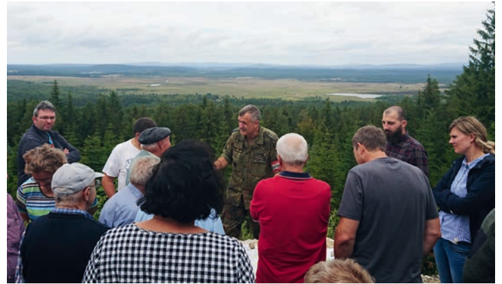
Ausblick vom Beobachtungspunkt „Bleidornturm“ zur Impact Area B

Anfang August unternahm die CSU Ortsgruppe Hartmannshof einen Tagesausflug in die benachbarte Oberpfalz. Als Ziel war Grafenwöhr mit dem Kultur- und Militärmuseum auserkoren, um die Geschichte und Entwicklung des „vor der Haustür gelegenen“ Truppenübungsplatzes näher kennen zu lernen. Am Nachmittag war eine Rundfahrt innerhalb des Übungsplatzes eingeplant.