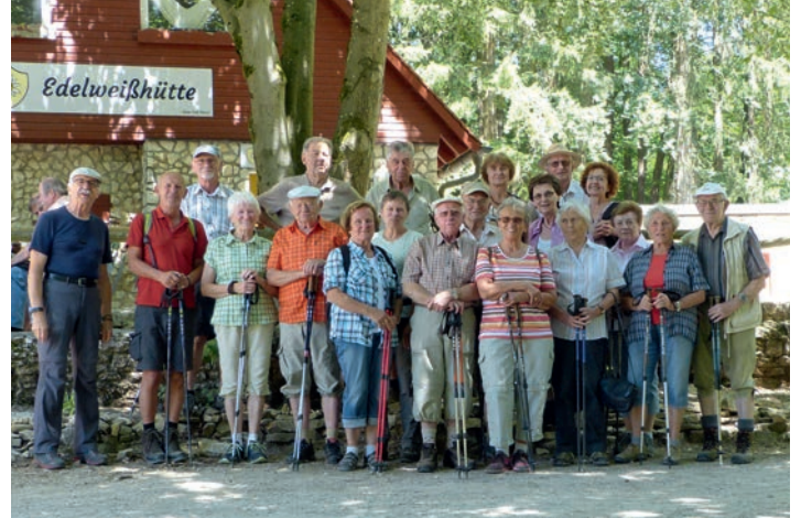
Die Wandergruppe vor der Edelweißhütte.

Wie immer, ist der Treffpunkt der Wanderfreunde/innen für die monatliche Wanderung, die Bushaltestelle bei der Raiffeisenbank in Pommelsbrunn und wie immer um 9:00 Uhr. Bei herrlichen Wetterbedingungen wird gesammelt zum Ausgangspunkt der Tour, dem Parkplatz beim Stausee-Oberbecken, bei Deckersberg, gefahren. Hier wartet schon der Rest der Truppe. So sind