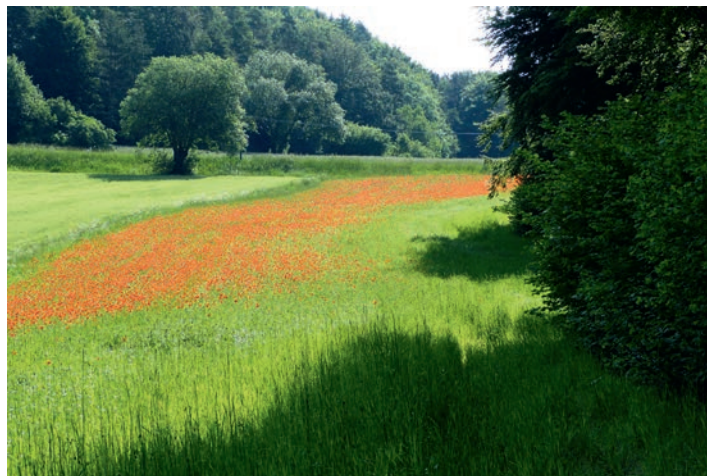
Mohnblumenfeld bei Bürtel

Die Mittagsrast ist im Gasthof „Zum Goldenen Hirschen“ der Familien Zuber gebucht. Die große Gruppe sitzt schon gemütlich im Wirtsgarten im Schatten unter den Sonnenschirmen als die kleine Gruppe nach einer Dorfbegehung eintrifft. Wir werden schnell