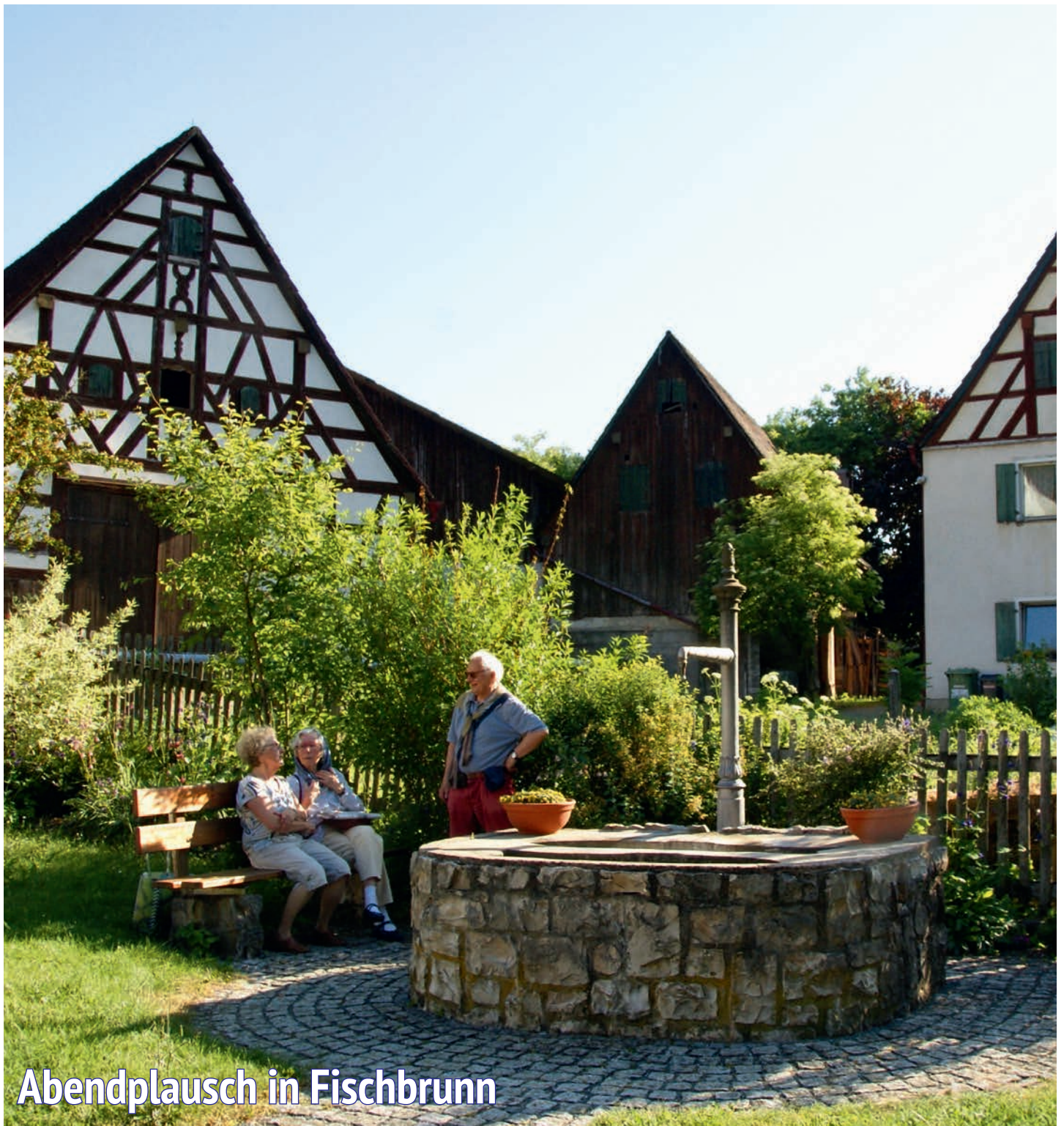
Abendplausch in Fischbrunn

mit Althaus, Appelsberg, Arzlohe, Bürtel, Fischbrunn, Guntersrieth, Hegendorf, Heldmannsberg, Heuchling, Hofstetten, Hubmersberg, Hunas, Kleinviehberg, Mittelburg, Reckenberg, Stallbaum, Waizenfeld, Wüllersdorf