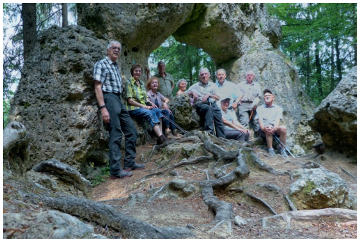
Gruppe am Noristörl

Bei der Juniwanderung ist Hirschbach das Ziel. Wir treffen uns alle am Parkplatz der Gastwirtschaft Sperber in Heuchling. Anscheinend der warmen Witterung geschuldet sind wir nur dreizehn Teilnehmer. Auf dem Wiesenweg unterhalb von Heuchling gehen wir nach Bürtel. Unterhalb des Ortes wandern wir, den Rotpunktweg folgend, Richtung Höhenglücksteig. Am Waldrand vor dem Höhenglücksteig trennt sich eine kleine Gruppe, die am Fuße des ersten