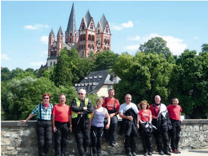
Dom zu Limburg

Auf ihrer diesjährigen 4-tägigen Motorradausfahrt haben neun Pommelsbrunner Naturfreunde wieder einige neue und schöne Fleckchen ihrer näheren und weiteren Heimat entdeckt.