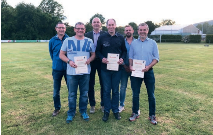
Das Foto zeigt die Vorsitzenden (hintere Reihe) samt Jubilaren (vordere Reihe).