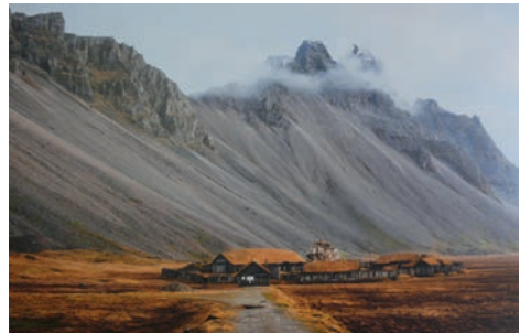
Fotografien von Island