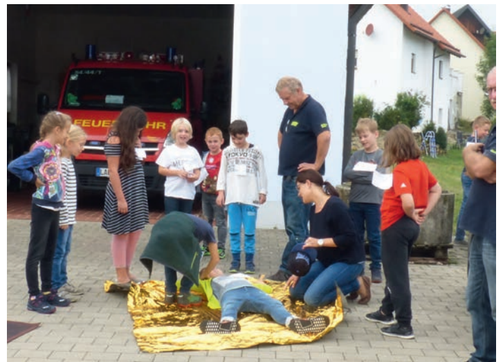
Die Kinderschar bei der Übung der Seitenlage.

den liegt? Diese Phase mit Ansprechen und richtiger Seitenlage wurde dann in der Praxis geübt. Auch das Holen der Hilfe durch Erwachsene und (theoretisch) die Reanimation kamen zur Sprache. Dieser Ablauf von Erster Hilfe ist in einer Broschüre der FFW enthalten, die gleichzeitig mit einem Quiz verbunden ist. Beim Ausfüllen im Schulungsraum halfen natürlich die Erwachsenen ein bisschen mit. Diese Unterlage brachte den Titel „Juniorhelfer“, zu dem die Kinder auch mit einer Urkunde bestätigt wurden. Für das Interesse und das Mitma-