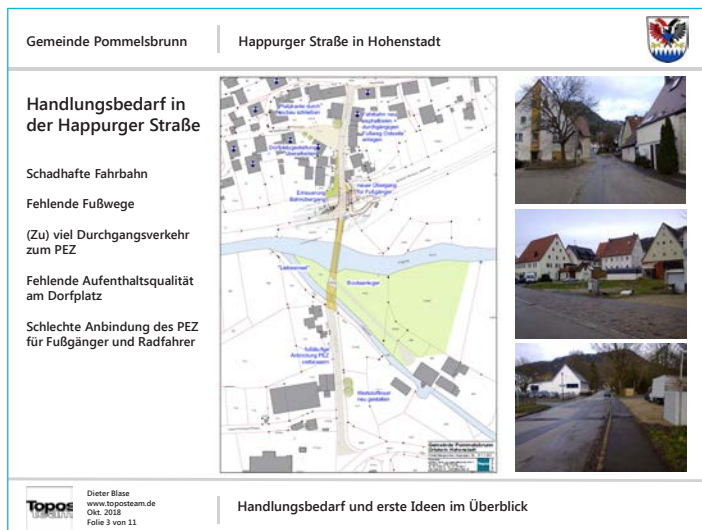
Die Happurger Straße in Hohenstadt.