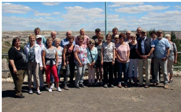
Das Bild zeigt die Reisegruppe inmitten des Braunkohleabbaugesbietes.

Unter der Führung eines sehr redseligen Reisebegleiters, steuerte der Busfahrer das „Braunkohle-Tagebau-Gebiet“ an. Zunächst war im Süden Leipzigs ein herrliches Naherholungsgebiet zu bestaunen. Dort hat sich – als Nachwirkung des Braunkohleabbaus – eine herrliche Seenlandschaft entwickelt.