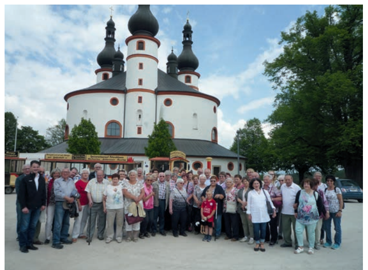
Die Gruppe der Ausflugs-Teilnehmer vor der „Kappl“, im Hintergrund der „Petersklause-Express“.