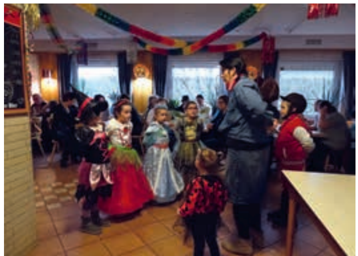
Faschingsgesellschaft. Die Darbietungen mit viel Applaus belohnt.

Höhepunkt des lustigen Faschingsnachmittages war der Auftritt der Nachwuchsgruppe der Hersbrucker