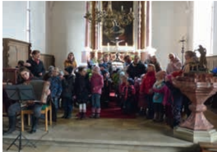
Die Kinderschar vor dem Altar