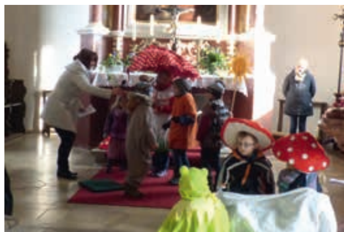
Gedränge unter dem Schirm

cken sollten. In der Andacht sprachen Eltern und Kinder ihre Fürbitten um den Schutz Gottes, bevor der Segen erteilt wurde und ein Gruppenchor aus dem KiGa-Personal das Lied dazu sang.