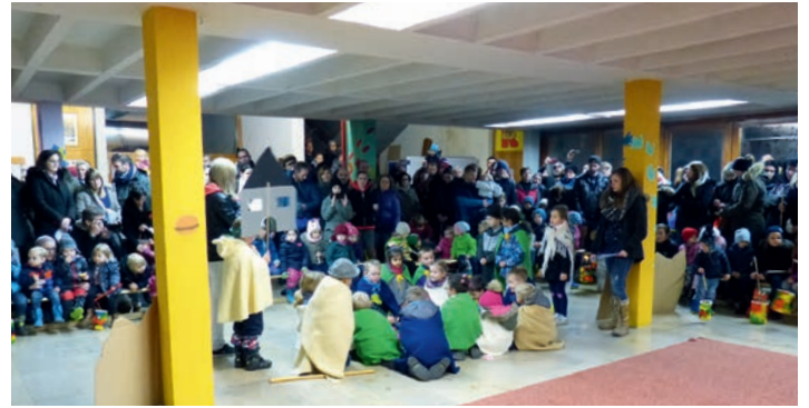
Die Bewohner Malons lauschen der Erzählung