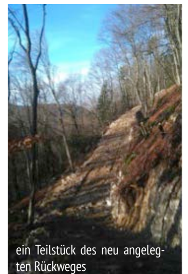
ein Teilstück des neu angelegten Rückeweges

Goldenen Straße, empfohlen. Eine mit dem Fränkischen Albverein e.V. abgesprochene Umleitung ist eingerichtet und führt unterhalb des neuen Weges vom Felsenweg über den Steinweg zum gewohnten roten „Z“. Die Gemeinde Pommelsbrunn bittet um ihr Verständnis! Im Zuge der Wegmarkierungsarbeiten im März und April 2018 wird eine neue Wegetrasse markiert, die mit einer schönen Wegführung im östlichen Teil aufwartet.