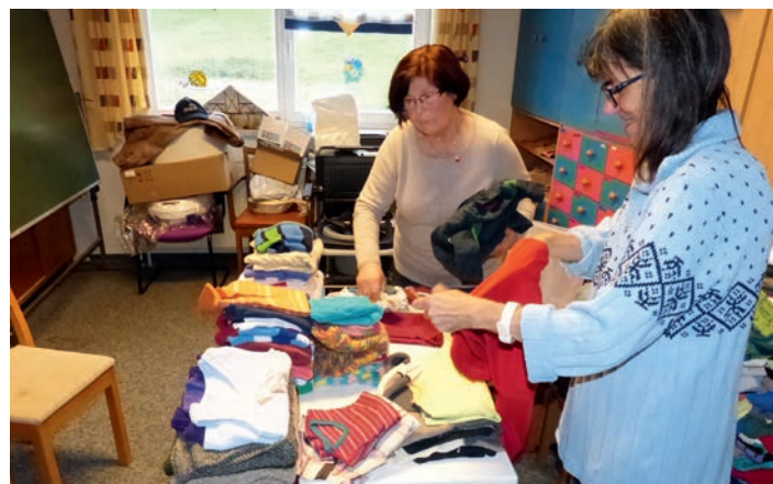
Beim Einpacken der Päckchen