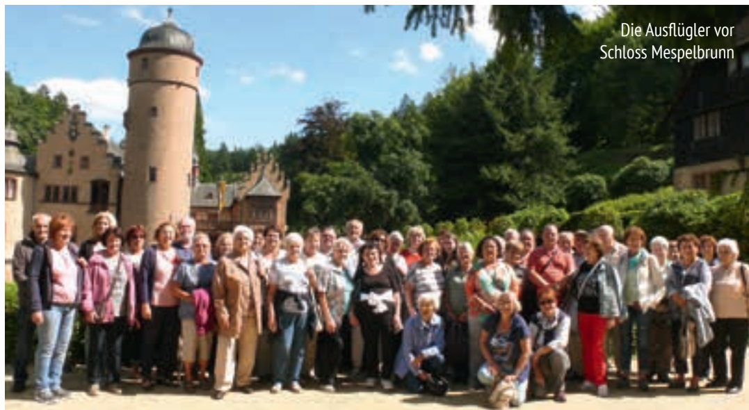
Die Ausflügler vor Schloss Mespelbrunn