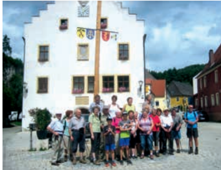
die Wandergruppe vor dem Rathaus Kastl

Im Gasthaus „Schwarzer Bär“ stärkten wir uns für den Rückweg durch das Hain-tal und gelangten über die Buchenhöhe zurück zu unserem Ausgangspunkt. jg