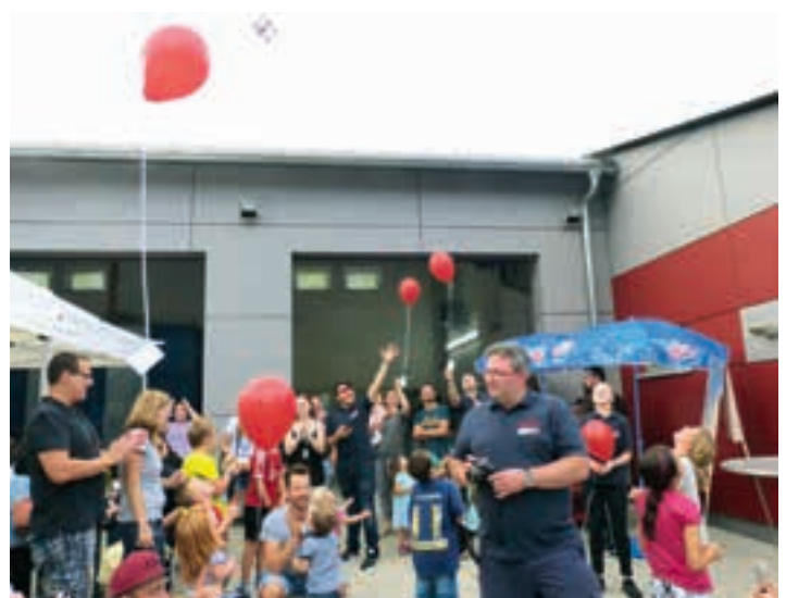
Dorffest mit Ballonflug, Fettbrand-Flamme