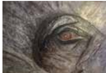
„Das Auge des Babar“

Unter diesem Motto kann die beeindruckende Ausstellung bis zum 31.10.2017 nach Vereinbarung besucht werden.