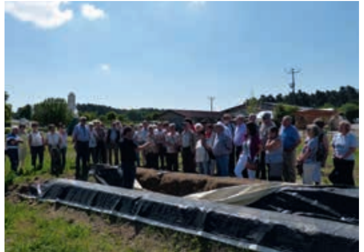
Erklärungen zu Anbau und Ernte im Spargelfeld

Dem Hof ist ein Verkaufsladen sowie gastronomischer Raum angegliedert. Hier blieb man gleich zum Mittagessen, das natürlich auf Spargelgerichte ausgerichtet war. Die Gartler ließen es sich munden und fuhr dann in das nahe Abensberg zur Bierwelt Kuchelbauer. Die Brauerei wurde vom Künstler Friedensreich Hundertwasser in ein faszinierendes Ausstellungsstück verwandelt. Durch die Schauräume zieht sich ein bewegter Wegweiser aus bunten Mosaiken und Keramikflächen. Nebenbei erfuhr man bei der Führung etwas über das Brauwesen