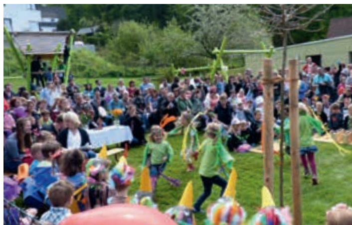
Tanz der Frühlingskinder

Danach strömte alle Gäste zu den Versorgungsstellen von Elternbeirat und KiGa-Personal, während die Kinder alle Spielgeräte und Klettergerüst sowie die Wasseranlage in Beschlag nahmen. Gut mundendes Mittagmahl,