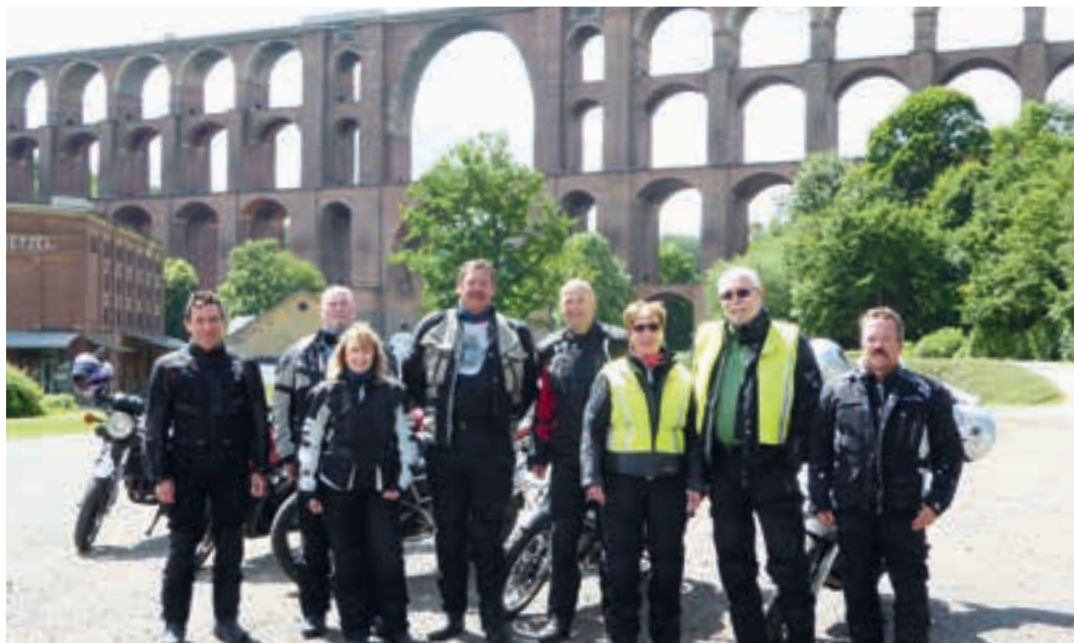
die Gruppe vor der Göltzschtalbrücke

„Rundum gelungen“, so war die einhellige Meinung aller Teilnehmer der diesjährigen Vier-Tages-Motorrad-Ausfahrt der Pommelsbrunner NaturFreunde. Als Ziel hatte man sich in diesem Jahr das Erzgebirge ausgesucht. Schon bei der Anfahrt durch die nördliche Oberpfalz, über Vohenstrauß und Tirschenreuth hinüber zu den tschechischen Nachbarn über Marienbad und Karlsbad kurvte man genüsslich auf ausgesuchten, wenig befahrenen Wegen. Bei der Mittagsrast in Chodovar/Kuttenplan ließ man sich die typisch böhmischen Knödel mit herzhaftem Gulasch schmecken.