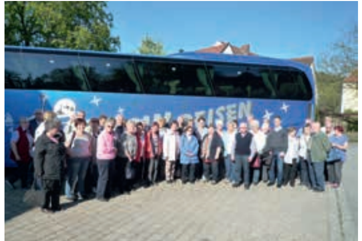
die Gruppe der Ausflugs-Teilnehmer vor dem Reisebus

Nachmittags wartete in Berching-Pollanten das Treidelschiff „Alma Victoria“ zur gemütlichen eineinhalbstündigen Treidel-Reise auf dem Ludwigskanal. Die einzige noch in Betrieb befindliche Schleuse 25 wurde auf halbem Weg erreicht. Insgesamt wurde eine Wasserhöhe von