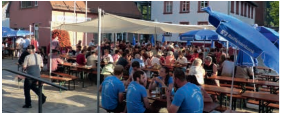
Gut besuchter Festplatz