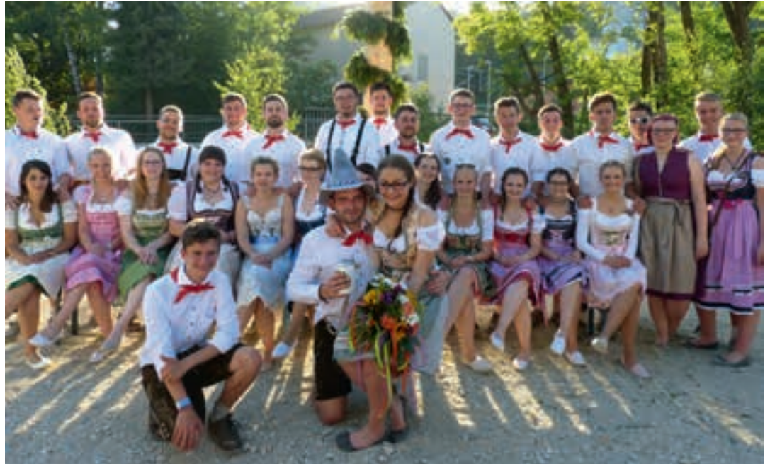
die ganze Kirwagesellschaft

Alle Paare fanden sich dann am Sonntagmorgen zum Gottesdienst in der nahen Friedenskirche ein. Tagsüber war lustiges Kirwatreiben auf dem Festplatz mit den Schaustellerbuden angesagt. Ab Nachmittag spielte die Blaskapelle Weingarts mit Unterhaltungsmusik im Zelt für die Gäste, die auf das Austanzen warteten. Die Paare zogen denn auch vom Kirwabrunnen zum Festplatz, von den Böllerschüt-