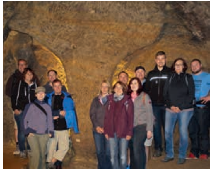
im sog. „Elefantenkeller“

Nach einer Stärkung im Schwandorfer Cafe Kostbar, führt uns der nächste Zughalt nach Sulzbach-Rosenberg. Dort besuchten wir die Brauerei Fuchsbeck und durften u.a. ein Rotbier kosten, das nur für besondere Anlässe gebraut wird. Nach einem ausgiebigen Aufenthalt im Biergarten, haben wir die Rückfahrt nach Hersbruck angetreten. Gemütlichen Ausklang fand der schöne Ausflug in der Hohenstädter Pizzeria. H. Seybold